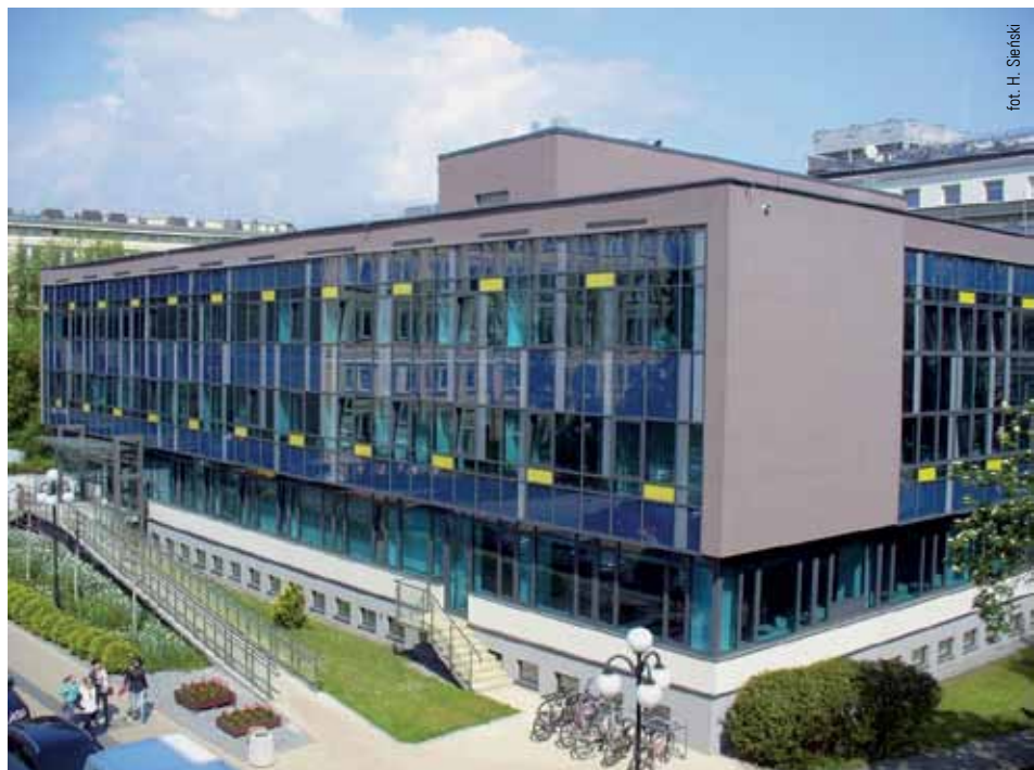
Biblioteka Główna AGH