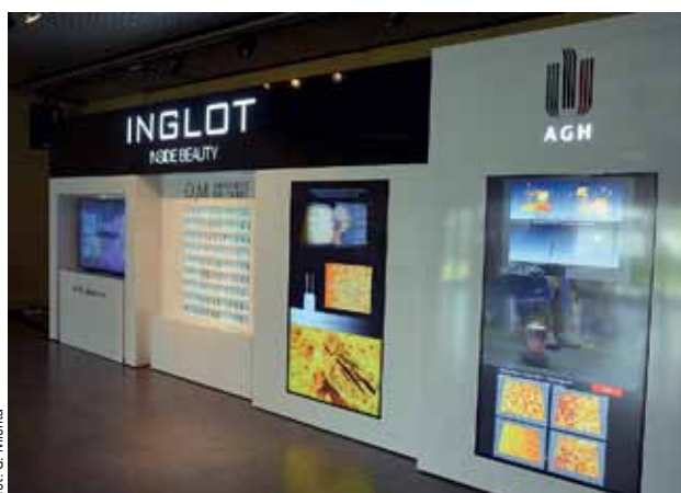
fort. G. Michta

W dniach 17–22 maja 2016 roku odbyła się w Krakowie trzecia edycja Copernicus Festival, którą tym razem poświęcono różnym wymiarom piękna. Celem organizowanego corocznie festiwalu jest pokazanie współistnienia i przeplatania się nauki i sztuki. Copernicus Festival wzorowany jest na World Science Festival, który co roku odbywa się w Nowym Jorku, gromadząc najlepszych światowych naukowców i rzeszę uczestników. Pomysłodawcą Copernicus Festival są Fundacja Tygodnika Powszechnego oraz Centrum Kopernika Badań Interdyscyplinarnych, a partnerem strategicznym festiwalu jest „Tygodnik Powszechny”.